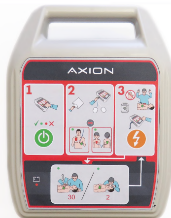
Дефибриллятор ДА-Н-05 с функцией автоматической наружной дефибрилляции.