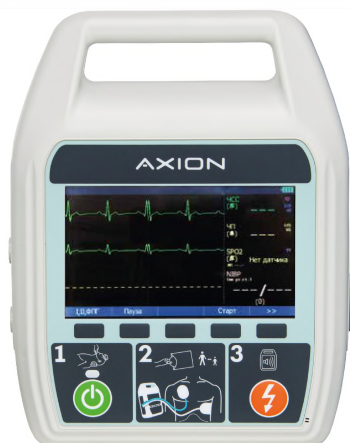
Дефибриллятор ДА-Н-02 с функцией ручной и автоматической наружной дефибрилляции.